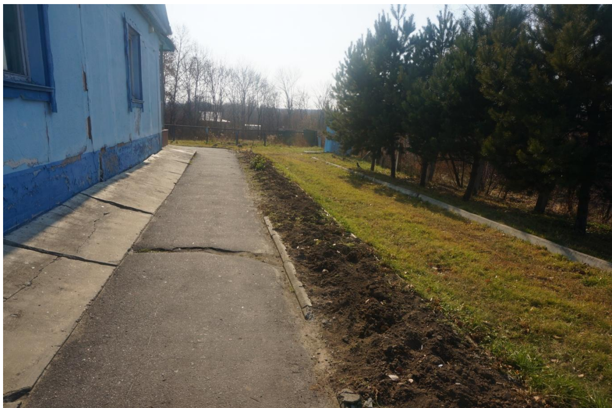
Фото территории в настоящее время