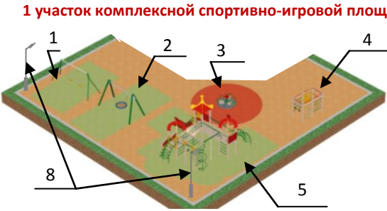
1 участок комплексной спортивно-игровой площадки