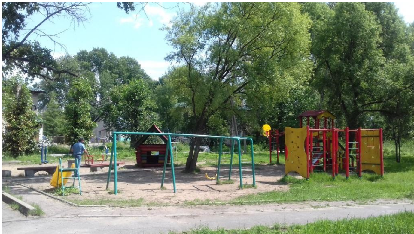
Фото территории в настоящее время