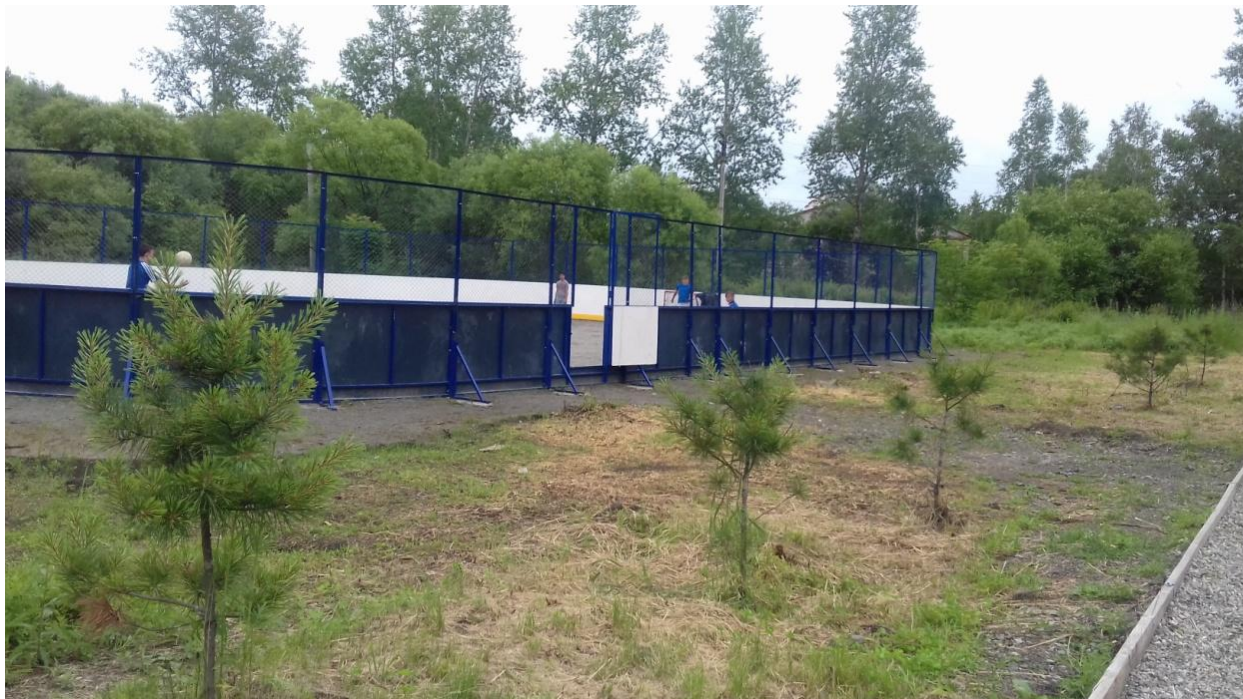
Фото территории в настоящее время