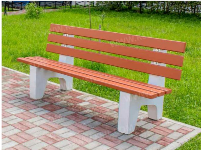
Скамья (2 шт.)

Габаритные размеры: 1950x720x860 мм Материалы: дерево, железобетон