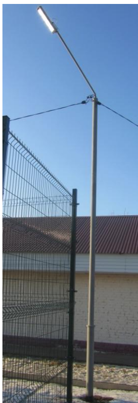
Световые опоры (2 шт.)

Стойки выполнены из металла. Высота стоек 9 м. (3 м. под землей, 6 м. над землей) диаметр 108 мм. - 4 м., диаметр 86 мм – 5 м., диаметр 40 мм. - 1,5 м. Окраска конструкции серой грунтовой краской.