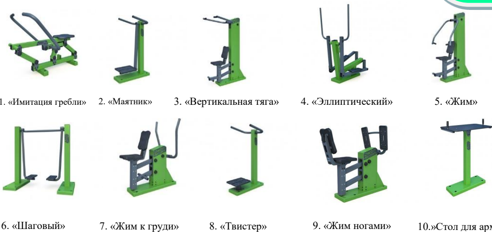
1. «Имитация гребли» 2. «Маятник» 3. «Вертикальная тяга» 4. «Эллиптический» 5. «Жим» 6. «Шаговый» 7. «Жим к груди» 8. «Твистер» 9. «Жим ногами» 10.»Стол для армреслинга»