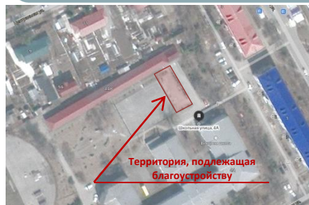
Территория, подлежащая благоустройству