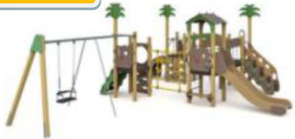
3. Игровой комплекс (для детей от 6 до 12 лет)