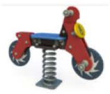
4. Качалка на пружине «Мотоцикл»