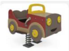
5. Качалка на пружине «Джип»