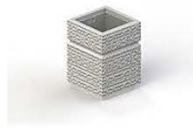
9. Урна (2 шт.)