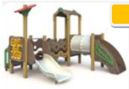
1. Детский игровой комплекс с горкой Н=500 (для детей от 2 до 5 лет)