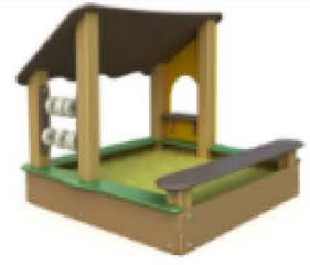
6. Песочница «Хижина»