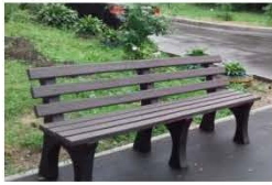
8. Лавочка (2 шт.)