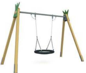
7. Качели «Гнездо»