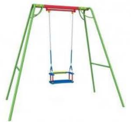
2. Качели на цепочках